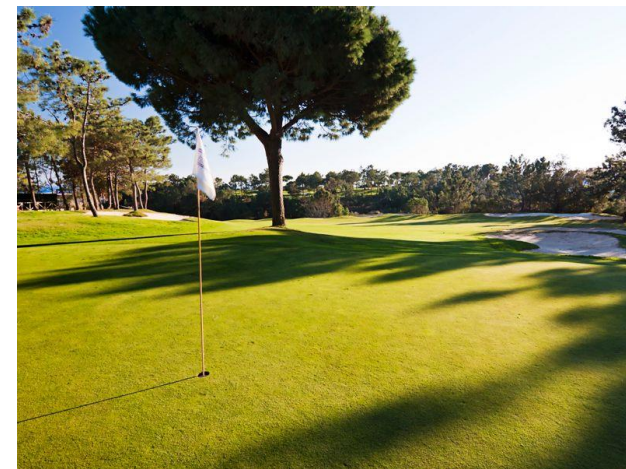
Golf du resort